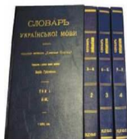
Словарь української мови Бориса Грінченка

Словник — довідкове зібрання слів у формі книги (нині й у комп'ютерному варіанті) з різномірною інформацією про них.