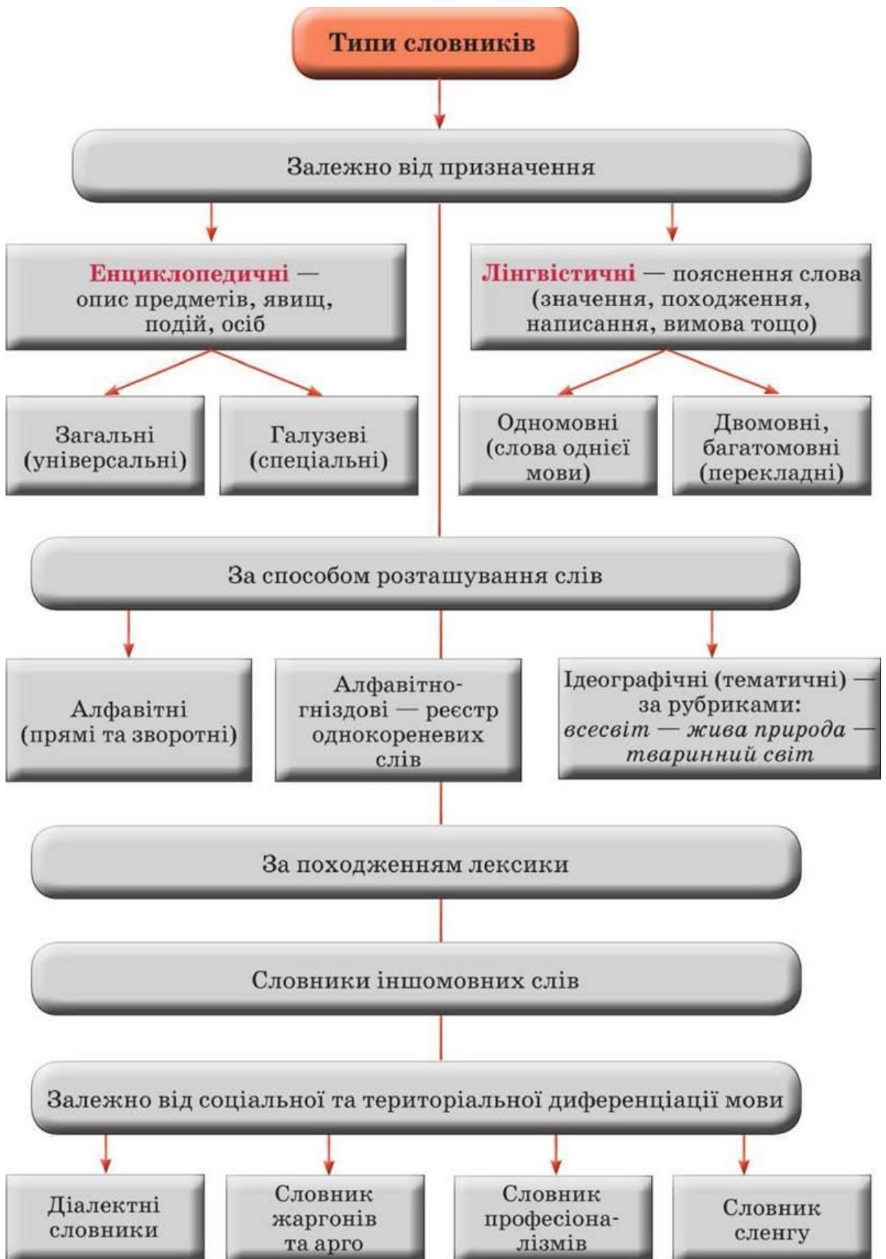
Таблиця № 1